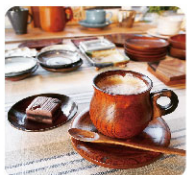
作家のうつわで カフェコーナー