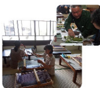
技を学ぶ・伝える レンタル教室